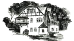
Haus zur Grabentour